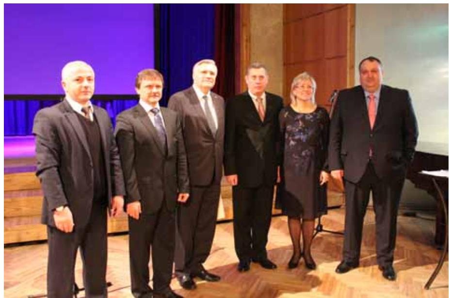
იმერეთის მხარის დელეგაციის ვიზიტი ლატვიაში