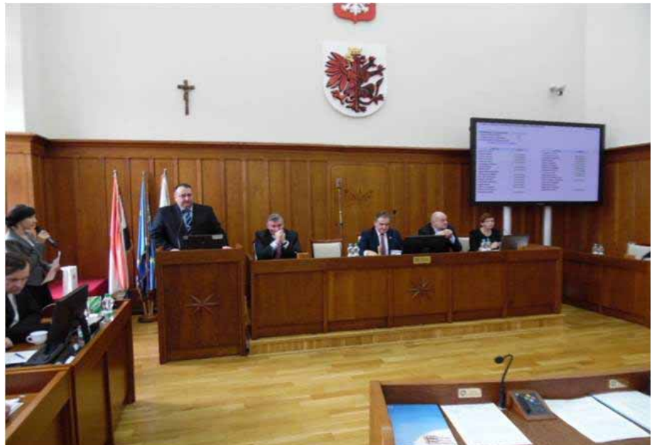
სიტყვით გამოსვლა კიუავესკო-პომორსკის საგოევიდოს პარლამენტში