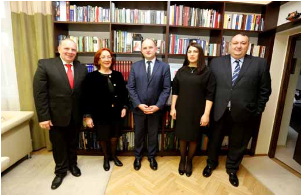
სახელმწიფო რწმუნებულის-გუბერნატორის ვიზიტი ტორუნში