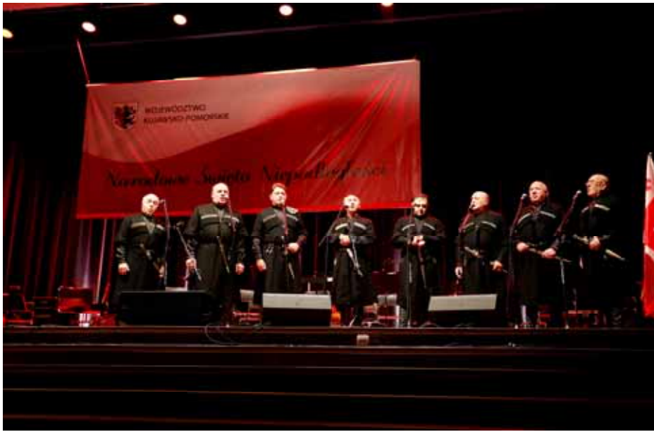
ანსამბლ "ქართული ხმები"-ს კონცერტი კოპერნიკის უნივერსიტეტში