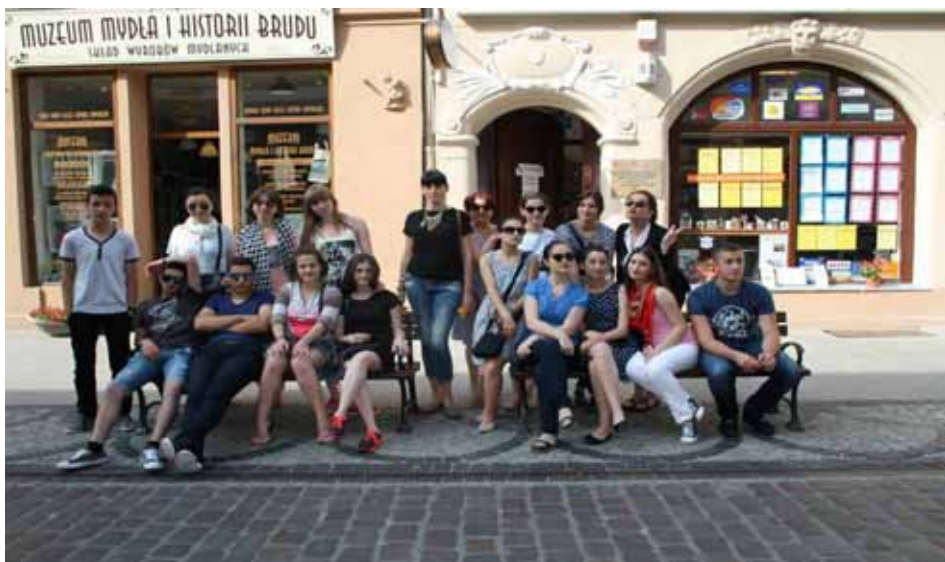
ახალგაზრდების ვიზიტი პოლონეთში