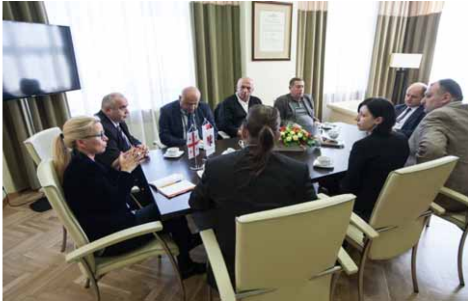
იმერეთის მუნიციპალიტეტების გამგებლების ვიზიტი ქალაქ ტორუნში