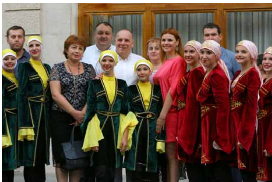
ბავშვთა ანსამბლ "არაბესკი"-ს ვიზიტი იმერეთში